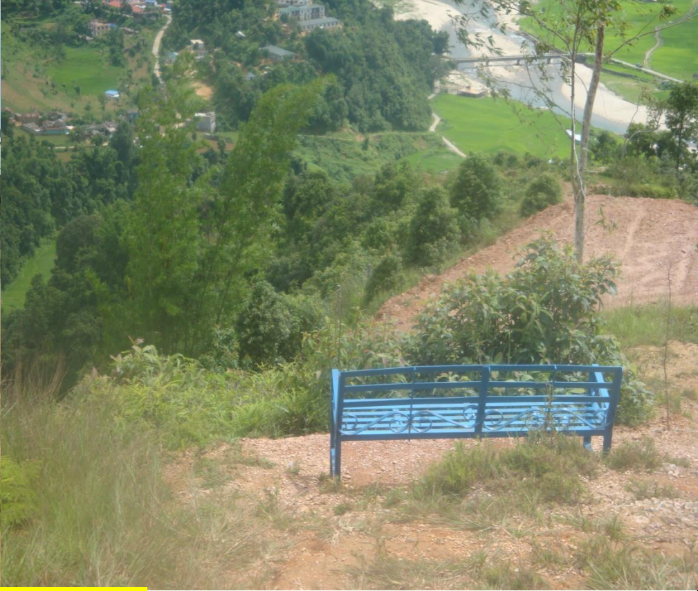
स्याङ्जा अग्लोडाँडा भ्यूपोईट उद्यान